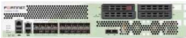
FortiGate 3140B 前面板