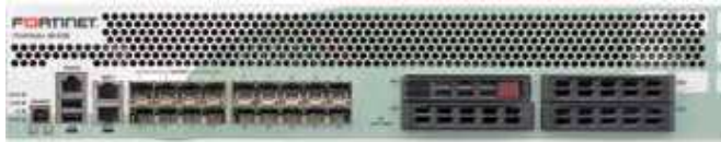
FortiGate 3040B 前面板